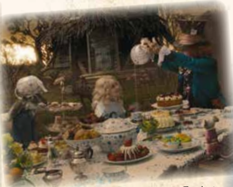
Alice aux pays des merveilles - Tim Burton