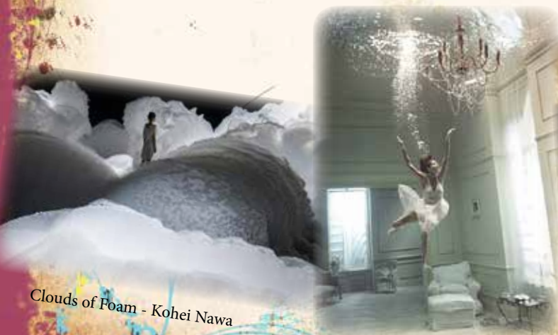
Clouds of Foam - Kohei Nawa