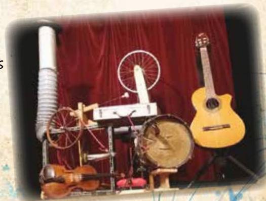
Antoine Dagallier - Bric à Brac Orchestra

Des morceaux de musique rétro seront également utilisés permettant de faire résonner des souvenirs d'enfance et l'imaginaire collectif.